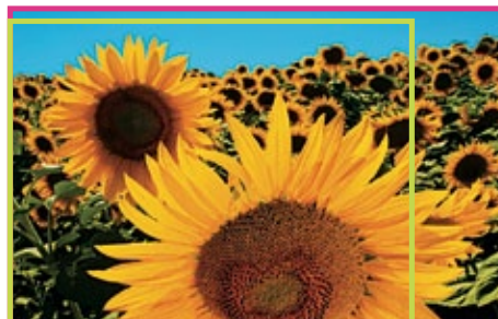
XGA 1.024 x 768 PIXEL WXGA 1.280 x 800 PIXEL

Wählen Sie zwischen XGA (1024 x 768) Auflösung oder WXGA Breitbildauflösung (1280 x 800). Heutzutage ist WXGA die Standardauflösung der meisten Technologiegeräte und wird weitgehend auch im Wirtschafts- und Bildungsbereich verwendet.