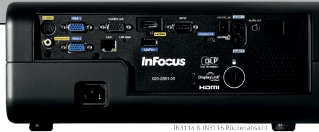
IN3114 & IN3116 Rückenansicht